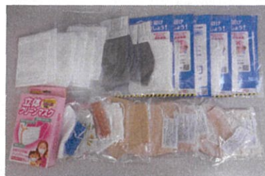
▲お寄せいただいたマスクの一部